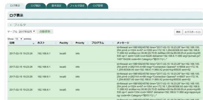
アクセスログ画面