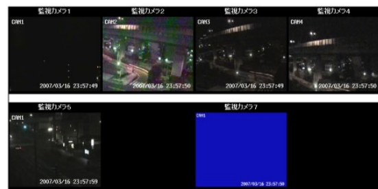
全画面表示アプリケーション